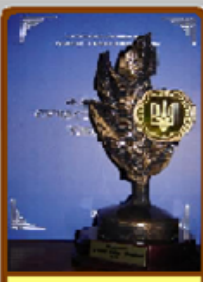
ЛІЦЕЙ - ФЛАГМАН ОСВІТИ УКРАЇНИ